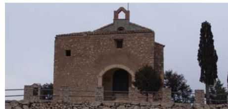
Ermita de Sant Pau. Joan Ferran.