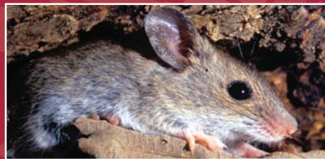
Ratolí de bosc. "Apodemus sp." Josep Genes