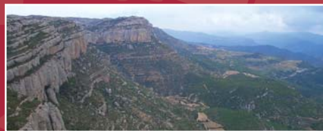
Cingles d'Scala Dei. Eva Crivillé.