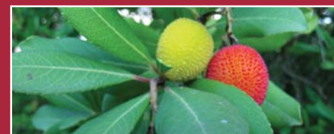
Arbucos "Arbutus unedo". Cierres de pastor. Roger Pascual.

Mas de Sant Antoni [10.3]: Situat on era abans l'antic poble de Montalt. Abandonat el 1285 fruit dels incontinents que van oferir els cartoixans als seus habitants. L'església del lloc és convertit en l'actual ermita, avui en ruïnes. Font Pregona [10.4]: Segons la tradició no s'esgota mai. Actualment abasta el poble d'Scala-Dei.