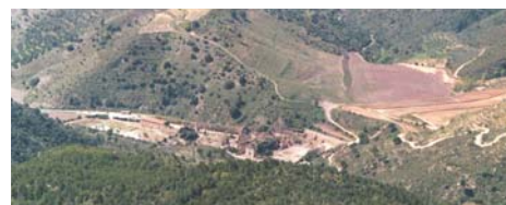
Cartoixa Vista aèria. Mireia Vilamala.