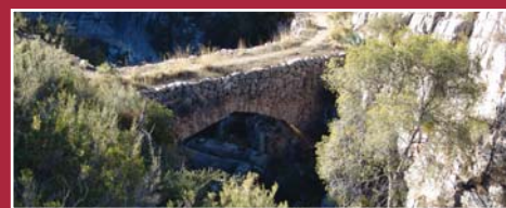
Pont de Cavaloca. Joan Ferran.

La Vilella Baixa, ubicada en l'aiguabarreig del Riuet d'Escaladei amb el riu Montsant a 214m d'altitud. La peculiar arquitectura de les cases li han donat el renom de la Nova York del Priorat. Els conreus principals són la vinya i l'olivera que ofereixen productes amb Denominació d'Origen. Església Parroquial: Dedicada a Sant Joan Baptista, d'estil neoclàssic. Carrer que No Passa: Mostra les traces medievals del poble. Barraca del Creuetes [7.3]: Obra de pedra seca, les lloses han estat curosament escollides i escairades. Probablement es va construir a finals del segle XIX, quan les vinyes del Priorat estaven en creixement. Grau dels Bous [7.1] i Grau del Coll Empedrat [7.4]: Mostra dels accessos empedrats que duïen a Montsant, camins rals, símbols de comunicació entre habitants d'un mateix entorn. Pont de Cavaloca [7.5]: Es tracta d'un pont singular, enlairat aprofitant l'estret de roca que excavà el riu. El seu nom vindria de l'àrab 'la collada de les àligues'. Encara avui en podem veure durant tot l'any, si tenim sort.