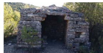
Barraca de Cal Creuetes. Joan Ferran.