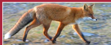
Guineu. "Vulpes vulpes". Josep Genet.

Cabacés és troba a 358m d'alçada, sobre un petit turó entre els barrancs de les Comes i de Montsant. D'origen medieval, les seves terres formaven part de la Baronia de Cabacés. Església Parroquial: Dedicada a la Nativitat de la Mare de Déu, conserva un interessant retaule gòtic del s.XIV. Museu Municipal: On s'exposen obres de Miquel Montaguó Borja i reproduccions de "El Greco." Ermita de Sant Joan [4.1]: Edifici barroc del segle XVIII. Conté mosaics de rajoles amb escenes bíbliques. Cabana de Peret Bassetes [4.3]: Construcció circular de pedra seca. La Covassa [4.5]: És una balma amb una edificació dins. Ermita de La Foia [4.6]: Les Foies és un redós amb parets de pedra que la tradició lliga amb cultes prehistòrics. Anomenada també, de les Neus, en record de la muller d'Alfons de Borbó que la visità el 1873. Sota seu hi ha una font, base de l'antic sistema de reg i sèquies del poble. Al jub de Sant Roc cisterna tallada a la roca, recuperada recentment, que s'observa en el coll que es troba abans d'arribar a l' Ermita de Sant Roc [4.7]: Construïda el 1594 aprofitant la paret d'una balma, el seu interior pertany al gòtic tardà.