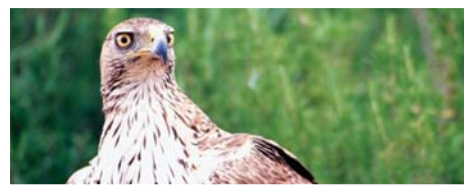
Àguila cuabarrada. Toni Borau.