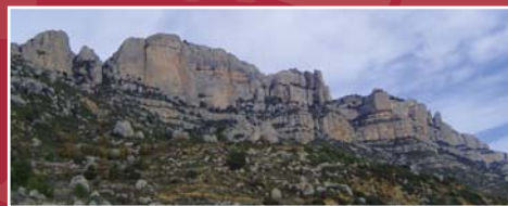
Cingle Major, Mireia Vilamala.

GRAU DE DIFICULTAT: ALT (no apte per a nens i persones amb vertigen).